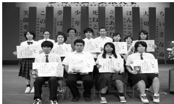
【高校生の主張大会】